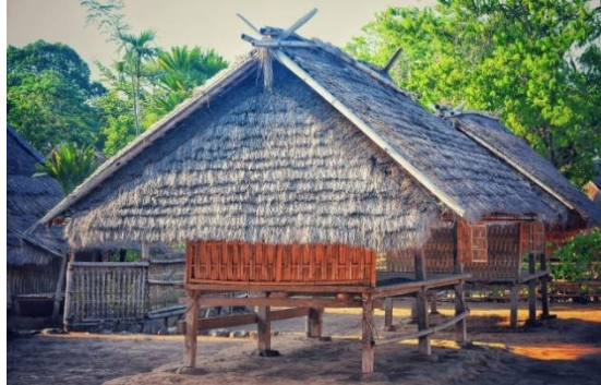
Gambar 4. Berugak Selengan

disusun dan disatukan dengan jumlah tiang sekepat (tiang empat) atau sekenem (tiang enam) dengan atap re (ilalang) maupun genting. Bentuk berugak biasanya memanjang menghadap ke utara-selatan dan pintu masuknya menghadap barat-timur seperti yang ada pada bale.