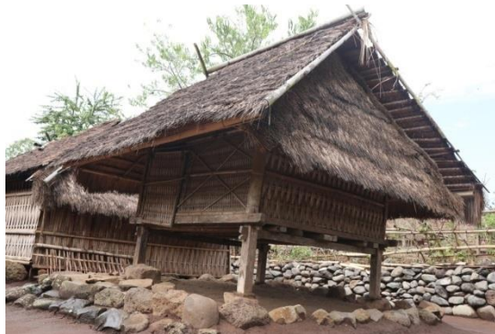
Gambar 5. Sambi / Lumbung

Sambi merupakan sebuah tempat penyimpanan khusus untuk padi beras dan padi bulu. Biasanya dimiliki oleh satu kepala keluarga yang ditempatkan diluar rumah dengan pintu masuk dibagian atasnya. Padi beras atau padi bulu yang disimpan di sambu biasanya diambil ketika mendekati upacara adat.