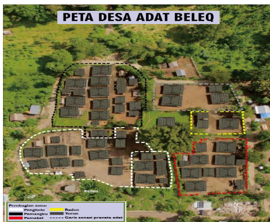
Gambar 7. Peta Rumah Adat Beleq

Tokoh adat bertugas memelihara hidup rukun di dalam masyarakat adat, menjaga supaya hukum itu berjalan dengan selayaknya. Dalam menjalankan peranan fungsi, wewenang dan tugasnya, maka tokoh adat harus mengikuti berdasarkan hukum adat. Aktivitas para tokoh adat sehari-hari meliputi seluruh lapangan masyarakat adat. Tidak ada satu lapangan pergaulan hidup di dalam masyarakat adat yang tertutup bagi tokoh adat untuk ikut campur bilamana diperlukan untuk memelihara ketentraman, perdamaian, keseimbangan lahir batin untuk menegakkan hukum adat.