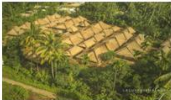
Gambar 1. Pemukiman Rumah Adat Beleq

dan bagian-bagiannya masih seperti zaman dahulu.