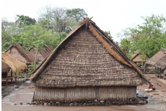
Gambar 2. Rumah Adat Beleq

Adapun arsitektur bangunan rumah adat ini terbuat dari bahan-bahan alami seperti bambu yang dianyam sebagai tembok rumah, ilalang yang ditata sedemikian rupa sebagai atap rumah, batu kali sebagai penguat rumah tanpa menggunakan paku dan semen, serta didesain dengan atap pendek disetiap ujung sisi bangunan sehingga ketika hendak masuk ke dalam rumah adat kita harus merunduk. Hal tersebut memiliki sebuah filosofi, yaitu ketika kita hendak masuk ke dalam rumah adat secara tidak langsung kita telah memberikan penghormatan ataupun salam kepada tuan rumah. Setiap bale yang dibuat, pintunya menghadap ke arah timur atau barat dan panjang rumah menghadap ke arah utara atau selatan.