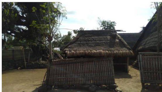
Gambar 6. Pawon / Dapur Adat

Penataan rumah-rumah adat beleq diatur berdasarkan 5 pranata bale adat. Setiap bale adat dihuni oleh pranata sosial masyarakat adat beleq yang terdiri dari lima pranata sesuai dengan nama bale-bale adat. Maing-masing pranata adat memiliki fungsi dan tugas yang berbeda, antara lain: