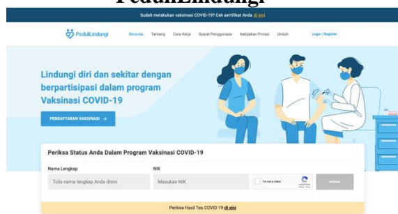
Gambar 1. Tampilan Aplikasi PeduliLindungi

Fasilitas publik yang akan melakukan proses pemindaian sebagai proses penyaringan terhadap warga masyarakat melalui aplikasi PeduliLindungi harus merupakan fasilitas publik yang penyelenggaraannya sudah diperbolehkan dan diatur melalui peraturan perundangan, seperti operasional pusat perbelanjaan/ mall yang berada di zona 2 dan zona 3 PPKM. Dalam konteks ini pemerintah akan memastikan bahwa hanya pihak pengelola fasilitas publik yang sudah diberi izin operasional yang dapat menyelenggarakan penerapan aplikasi PeduliLindungi .