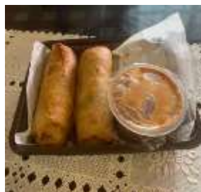
Gambar 1 Lumpia Jakarta

elemen konsruktif dalam pembentukan citra sebuah destinasi wisata maka akan memperkaya wisata gastronomi di Kota Jakarta yang wajib dikunjungi oleh wisatawan. Pada elemen ke tujuh Gastronomi sebagai tujuan perjalanan wisata, dengan banyak potensi yang ditawarkan sejarah kuliner di Pecenongan Jakarta Pusat ini tentu menjadi daya tarik wisatawan untuk mengunjungi Jakarta. Gastronomi sebagai unsur warisan dengan dimensi wisata merupakan indicator terakhir dari terbentuknya konsep destinasi gastronomi. Dari seluruh indikator sesuai dengan pengembngan wisata gastronomi di Kawasan Pecenongan Jakarta. Analisa yang telah dilakukan pada penelitian kali ini sudah menggunakan semua indicator pada tiga macam kuliner tersebut dan sangat sejalan untuk dikembngkan sebagai destinasi wisata kuliner gastronomi. Di bawah ini terdapat foto dari ketiga jenis kuliner tersebut.