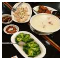
Gambar 2