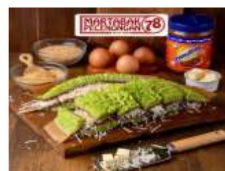
Gambar 3