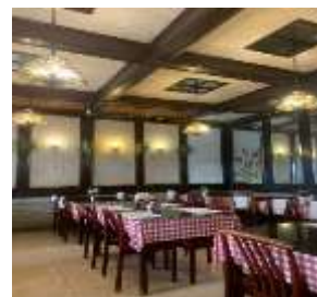
Gambar 2 Lumpia Jakarta