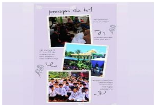
Gambar 7 Kegiatan Aktualisasi oleh Sherly Esa Okataviani

Disini menjelaskan rukun islam dan juga rukun iman beserta isinya dari rukun islam dan rukun iman tersebut dengan manfaat yang diperoleh yaitu Anak-anak dapat mengetahui dan menghafal rukun Islam dan rukun iman serta bisa memahami isinya sehingga anak anak tidak hanya paham tetapi anak anak menjadi tahu apa isi dari kedua rukun tersebut, program ini dilakukan didaerah Perum Graha Echa, Tampan, Pekanbaru, Riau.