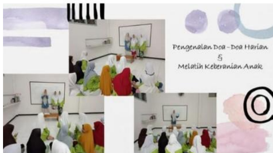
Gambar 9 Kegiatan Aktualisasi oleh Yuni Afriliani

akan beriman kepada Allah SWT dan juga lebih bertaqwa. Program ini dilakukan di saerah Pondok Pesantren Darul Arqom.