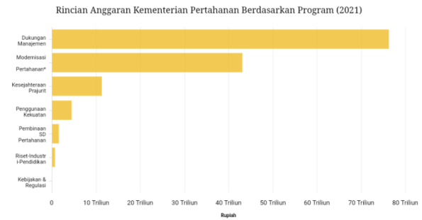
Gambar 1.2 Rincian Anggaran Kementerian Pertahanan Berdasarkan Program 2021

Anggaran pertahanan dibagi menjadi tujuh program yang meliputi gambar di bawah: