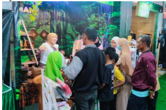
Gambar 1 Pameran bazar industri

bahwa modal sosial memiliki dampak yang signifikan terhadap outcome pembangunan seperti pertumbuhan ekonomi. Hal ini mempermudah pengrajin untuk belajar dan menerapkan strategi digital marketing untuk meningkatkan koneksi pemasaran ataupun promosi Industri kerajinan kayu. Kepercayaan dalam menjalin kerja sama bertujuan untuk mendapatkan keuntungan, dengan bermodalkan jujur dan saling percaya pengrajin dapat membangun kemistri yang baik antara pengrajin kayu. Rasa percaya pelaku usaha dengan penyuluh merupakan salah satu bentuk kemampuan pelaku usaha kerajinan kayu untuk mengerti kebijakan pemerintah Desa (Hiola, 2022). Salah satu bentuk kebijakannya adalah adanya pameran bazar industri yang bertujuan untuk memamerkan kerajinan kayu kepada masyarakat luas.