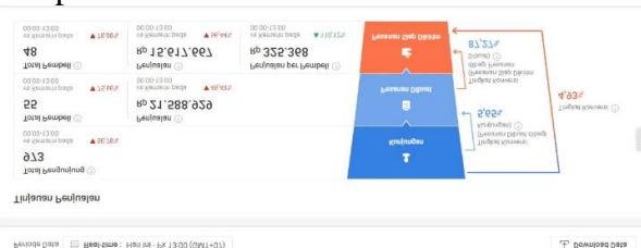
Gambar 3 Hasil performa pelayanan chat customer

Peningkatan jumlah chat dengan konsumen sejalan dengan adanya keterlibatan ini. Konsumen yang merasa terhubung dengan seller melalui modal sosial cenderung lebih aktif dalam berinteraksi melalui platform chat di marketplace. Dengan memberikan respon yang cepat dan relevan, penjual dapat meningkatkan kepuasan konsumen, membangun kepercayaan, dan mendorong konversi penjualan. Meskipun mengalami fluktuasi namun "Djati Moelek" sebagai seller terus berupaya memperbaiki pelayanan dan performa toko.