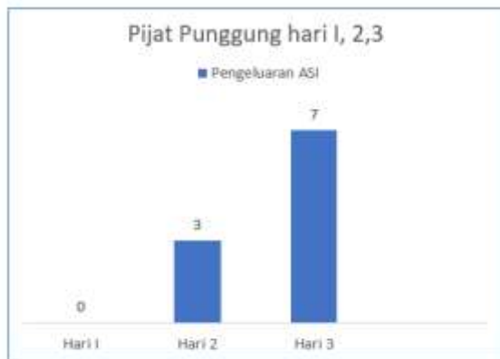
Grafik 2. Pijat Punggung dengan kelancaran pengeluaran ASI Hari I, II, III

Selanjutnya hasil pijat punggung hari pertama, kedua dan ketiga dapat dilihat pada grafik berikut;