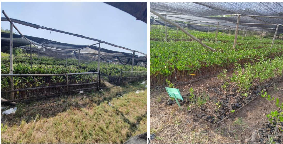
Gambar 6. Stok bibit dalam polybag yang sudah tua dan tidak laku dijual selama pandemic Covid-19

Permasalahan yang dihadapi adalah menumpuknya stok bibit dalam polybag (Gambar 6) yang dalam kondisi pandemik Covid-19 sejak tahun 2020 lalu berdampak terhadap berhentinya program reboisasi pantai dan penanaman mangrove. Ratusan ribu bibit sudah terlalu dewasa dan akar sudah keluar dari polybag, sehingga rentan kematian karena putusnya akar saat diangkat. Petani kehilangan penghasilan. Demikian juga objek wisata yang harus tutup sementara, mengakibatkan keterpurukan perekonomian masyarakat. Guna mengatasi hal tersebut, maka masyarakat diajari untuk menanam mangrove di pot sebagai tanaman hias (Gambar 7). Upaya ini dilakukan guna mendukung pengembangan JM Pasarbanggi Rembang sebagai destinasi ekowisata unggul di Jawa Tengah.