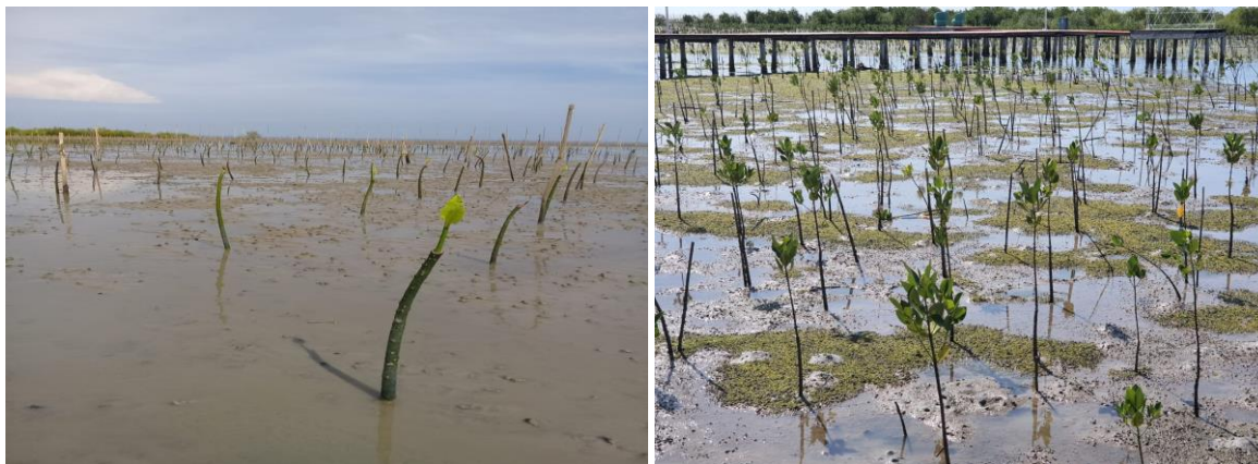
Gambar 3. Penanaman 5.000 bibit mangrove di area akresi sebelah barat Jembatan Mangrove dengan 5 jenis tanaman mangrove yang masuk dalam Redlist IUCN. Selain upaya konservasi jenis, juga proteksi pantai (2020) dan penanaman untuk menutup lahan yg masih kosong karena pembibitan gagal (2021)

Pembibitan mangrove yang optimal untuk ditanam di bagian pantai yang terkena akresi. Hal ini sebagai upaya rehabilitasi mangrove yang harus dilaksanakan. Seringkali kegiatan rehabilitasi mengalami kegagalan, seperti yang dilakukan pada kegiatan Pengabdian kepada Masyarakat di Pasarbanggi Rembang ini. Penanaman mangrove di pantai sebanyak 5.000 bibit telah dilaksanakan pada bulan Oktober 2020 dengan bibit yang ditanam antara lain R. stylosa , R. mucronata , R. apiculata , Avicenia marina , dan Bruguiera yang dapat tumbuh kurang dari 10%. Pada tahun 2021 dilakukan penanaman pada lokasi kosong yang berdekatan dengan JM. Lokasi kosong semacam ini merupakan lahan yang gagal penanaman dengan propagul tahun sebelumnya (Gambar 3). Pada lokasi ini kemudian ditanam bibit mangrove yang berasal dari polybag. Hal ini perlu dilakukan untuk menyongsong dibukanya tempat wisata bagi umum, sehingga menjadi lebih sejuk.