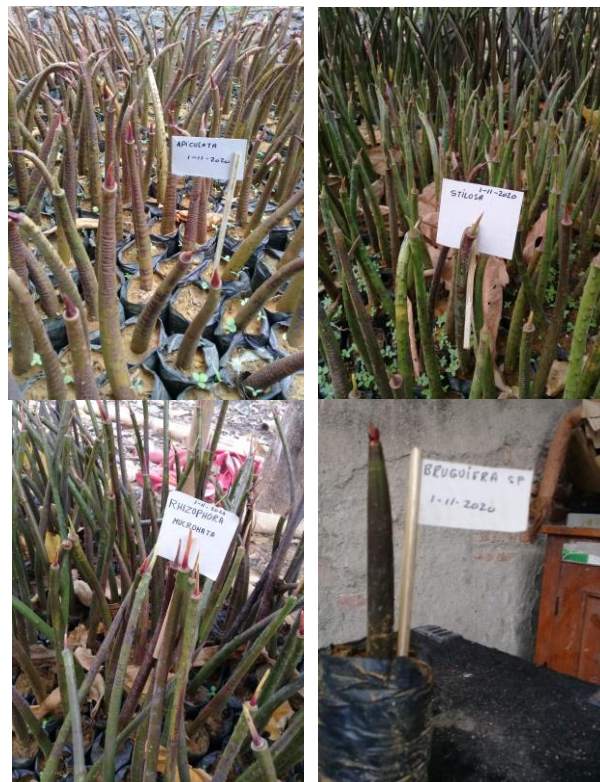
Gambar 5. Pembibitan propagule dalam polybag

Pertumbuhan propagul mangrove ditentukan banyak faktor diantaranya adalah naungan. Intensitas naungan terbaik untuk pertumbuhan propagule R. mucronata adalah 25 % dan 50%. Intensitas cahaya berpengaruh signifikan terhadap penambahan biomassa. Kematangan bibit dan waktu penanaman juga menentukan keberhasilan rehabilitasi mangrove. Berdasarkan pengalaman Kelompok Tani Sido Dadi Maju Pasarbanggi Rembang, tingkat hidup bibit yang tumbuh adalah 30%. Oleh karena itu maka dalam kegiatan pengabdian kepada masyarakat ini kelompok tani disarankan untuk menanam bibit di polybag jenis-jenis yang ada dalam Red List IUCN ( International Union for Conservation of Nature ) dengan propagul yang sudah tua (Gambar 5). Pemeliharaan harus dilakukan untuk mengganti bibit yang mati dengan bibit baru.