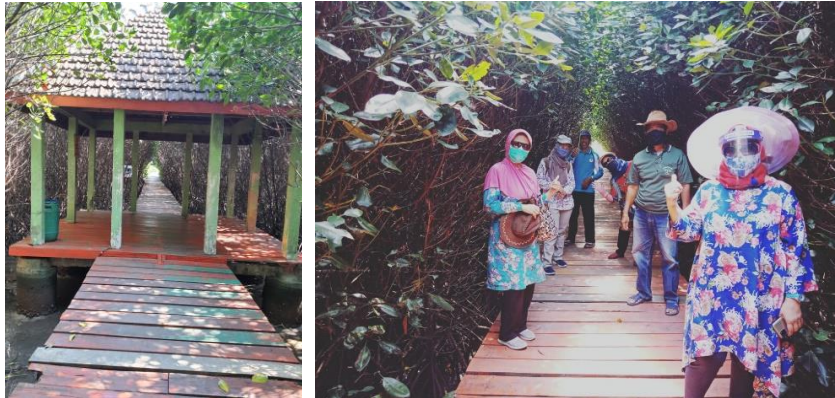
Gambar 2. Potensi JM Pasarbanggi Rembang sebagai ekowisata

Pembibitan mangrove yang optimal untuk ditanam di bagian pantai yang terkena akresi. Hal ini sebagai upaya rehabilitasi mangrove yang harus dilaksanakan. Seringkali kegiatan rehabilitasi mengalami kegagalan, seperti yang dilakukan pada kegiatan Pengabdian kepada Masyarakat di Pasarbanggi Rembang ini. Penanaman mangrove di pantai sebanyak 5.000 bibit telah dilaksanakan pada bulan Oktober 2020 dengan bibit yang ditanam antara lain R. stylosa , R. mucronata , R. apiculata , Avicenia marina , dan Bruguiera yang dapat tumbuh kurang dari 10%. Pada tahun 2021 dilakukan penanaman pada lokasi kosong yang berdekatan dengan JM. Lokasi kosong semacam ini merupakan lahan yang gagal penanaman dengan propagul tahun sebelumnya (Gambar 3). Pada lokasi ini kemudian ditanam bibit mangrove yang berasal dari polybag. Hal ini perlu dilakukan untuk menyongsong dibukanya tempat wisata bagi umum, sehingga menjadi lebih sejuk.