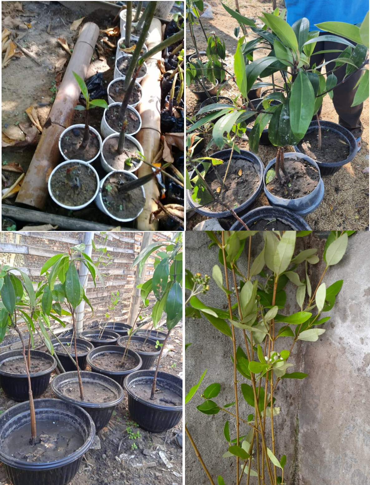
Gambar 7. Penanaman propagule dalam pot yang akan dikembangkan sebagai tanaman hias