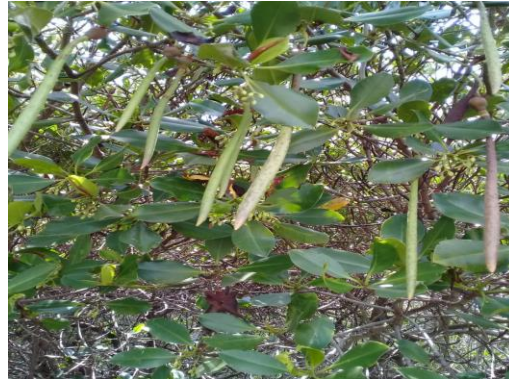
Gambar 4. Propagule mangrove di Pasarbanggi Rembang

Pertumbuhan propagul mangrove ditentukan banyak faktor diantaranya adalah naungan. Intensitas naungan terbaik untuk pertumbuhan propagule R. mucronata adalah 25 % dan 50%. Intensitas cahaya berpengaruh signifikan terhadap penambahan biomassa. Kematangan bibit dan waktu penanaman juga menentukan keberhasilan rehabilitasi mangrove. Berdasarkan pengalaman Kelompok Tani Sido Dadi Maju Pasarbanggi Rembang, tingkat hidup bibit yang tumbuh adalah 30%. Oleh karena itu maka dalam kegiatan pengabdian kepada masyarakat ini kelompok tani disarankan untuk menanam bibit di polybag jenis-jenis yang ada dalam Red List IUCN ( International Union for Conservation of Nature ) dengan propagul yang sudah tua (Gambar 5). Pemeliharaan harus dilakukan untuk mengganti bibit yang mati dengan bibit baru.