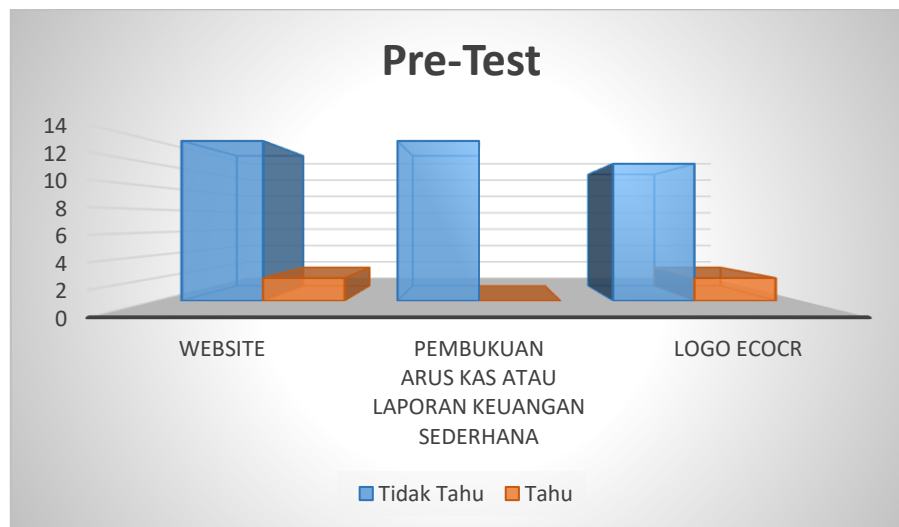
Gambar 1. Tingkat Pengetahuan Peserta Sebelum Kegiatan

Kegiatan ini masyarakat terlebih dahulu diberikan penyuluhan tentang pemanfaatan website dan pendampingan membuat pembukuan arus kas atau laporan keuangan sederhana. Setelah dilakukan kegiatan pelatihan dengan demonstrasi maka dilakukan evaluasi dengan membagikan kuisioner kepada para peserta untuk melihat tingkat pengetahuan peserta sebelum dan sesudah kegiatan, maka didapatkan hasil sebagai berikut: