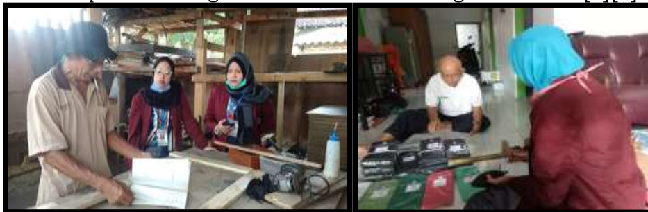
Gambar 1. Observasi Sistem Pelaporan UMKM

merasa terbebani dengan adanya pembukuan pada keuangan sehingga mereka juga merasa sulit untuk mendata manual pada setiap harinya. Pada saat penyuluhan di desa nogosari masyarakat diberikan inovatif agar bisa megoprasikan pembukuan secara digital agar lebih mudah saat mendata laporan keuangan atau bisa di sebut dengan buku kas [4][5].