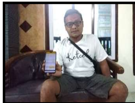
Gambar 5. Penggunaan Aplikasi Buku Kas

Dari hasil di atas dapat diketahui ada kenaikan dalam menggunakan aplikasi pelaporan buku kas dalam hasil penyuluhan dan pembinaan UKM ada kenaikan berkisar antara 50% sampai dengan 60%.