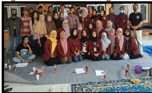
Gambar 3. Pembukaan proses penyuluhan

Dengan adanya aplikasi yang membantu UMKM Desa ini diharapkan nantinya semua elemen masyarakat baik produsen, distributor dan juga konsumen dapat mengetahui perkembangan-perkembangan yang ada dalam bidang IT dengan mudah setelah adanya penyuluhan ini. Sehingga tak hanya produsen dan distributor saja yang mengetahui hal ini namun juga seluruh lapisan generasi muda. Pengusaha dapat melakukan proses unduh aplikasi ini dengan mudah, yaitu dengan memanfaatkan playstore yang ada pada Gadget masing-masing. Dengan seperti itu kita dapat mengontrol jenis pemasukan dan pengeluaran keuangan UMKM usaha kita dengan memanfaatkan Gadget tersebut.