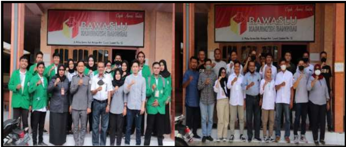
Gambar 7. Foto bersama pada saat penerimaan dan penarikan kegiatan pengabdian Bersama Komisioner Bawaslu, Koordinator Sekretariat dan Staf, Dosen dan Mahasiswa

Kondisi kesehatan juga menjadi tantangan kesuksesan penyelenggaraan pemilu serentak 2024. Kondisi Pandemi Covid-19 yang belum berakhir membatasi pergerakan masyarakat, peserta pemilu, penyelenggara pemilu, dan pihak-pihak terkait untuk secara leluasa melakukan kegiatan-kegiatan pemilu seperti kampanye, dialog-dialog, rapat-rapat dan pelatihan-pelatihan. Penyelenggara pemilu dibayang-bayangi efek covid-19 karena memiliki banyak kegiatan yang bersentuhan dengan kerumunan dan pergerakan di dalam dan luar daerah.