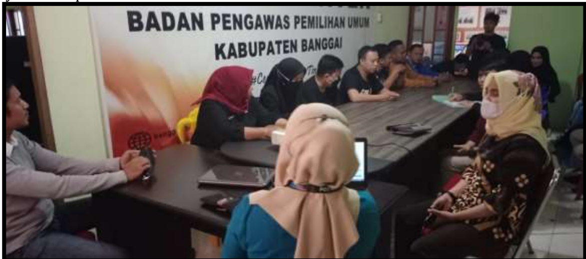
Gambar 4. Desiminasi Layanan Digital yang dilaksanakan pada hari Jum'at, 28 Januari 2022 bertempat di ruang rapat Bawaslu ini dihadiri oleh Anggota Bawaslu dan Koordinator Sekretariat serta staf Bawaslu.

Wilayah Kabupaten Banggai yang sebagian besar berada di daerah pedesaan, pegunungan dan sebagian wilayah kepulauan. Yang mana di Kepulauan dan pegunungan yang minim Infrastruktur dan minim dukungan teknologi informatika menjadi tantangan dalam kelancaran penyelenggaraan pemilu serentak 2024. Terdapat beberapa desa yang masih sulit dijangkau oleh kendaraan roda 2 dan roda 4, masih ada beberapa desa yang harus melewati sungai tanpa adanya sarana Jembatan, masih ada beberapa desa yang belum dijangkau oleh sarana listrik negara, masih ada beberapa desa yang sulit dijangkau oleh jaringan telekomunikasi, terlebih-lebih di daerah kepulauan yang desa dan TPS nya hanya dilalui oleh lautan, sehingga akses transportasi sulit tersedia kecuali menyewa perahu milik nelayan setempat.