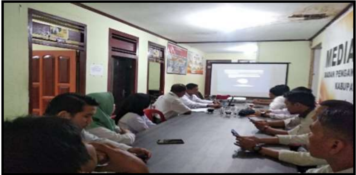
Gambar 3. Desiminasi tentang Money Politik dan Kode Etik Komisioner Bawaslu, Dosen dan Mahasiswa