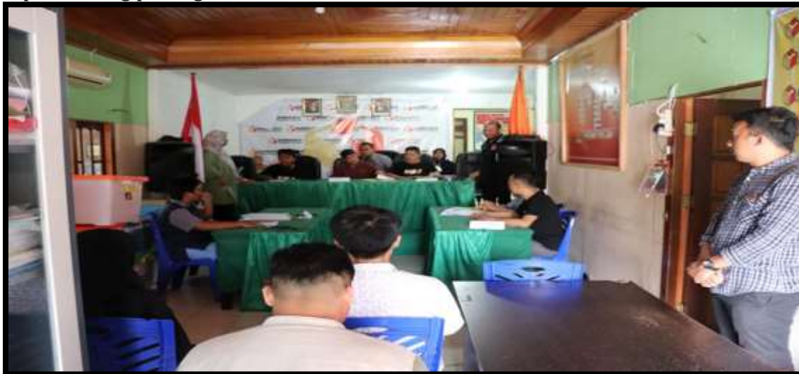
Gambar 5. Simulasi Musyawarah Terbuka pada jum'at, 4 Februari 2022 yang dihadiri oleh Komisioner Bawaslu Provinsi (Devisi Penyelesaian Sengketa), Komisioner Bawaslu Banggai, seluruh staf Bawaslu, dan Mahasiswa

Kondisi keamanan dan ketertiban masyarakat pada perhelatan beberapa pemilu dan pilkada untuk periode terakhir tercipta dengan kondusif, aman dan lancar. Walaupun, ada beberapa kejadian gangguan keamanan yang dapat dikendalikan oleh pihak keamanan yakni peristiwa pada Pemilu tahun 2019 tentang keterlambatan distribusi logistik pemungutan dan penghitungan surat suara untuk 7 kecamatan oleh KPU kabupaten Banggai sehingga hari pemungutan yang seharusnya 17 April 2019 menjadi 18 April 2019 dan PSU (Pemungutan Suara ulang) untuk desa tuntung kecamatan Bunta. Serta peristiwa Pemilihan serentak tahun 2020 yang diwarnai dengan pelaksanaan aksi demonstrasi oleh kelompok-kelompok tertentu pendukung pasangan calon.